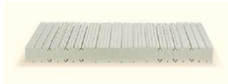
Natural Basic Z7 Male