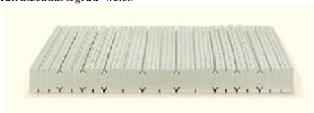
Natural Basic Z7 Female

Bei der Natural Basic Z7 können Sie aus den gleichen 4 Bezugsvarianten wählen wie bei der gesamten Basic Line